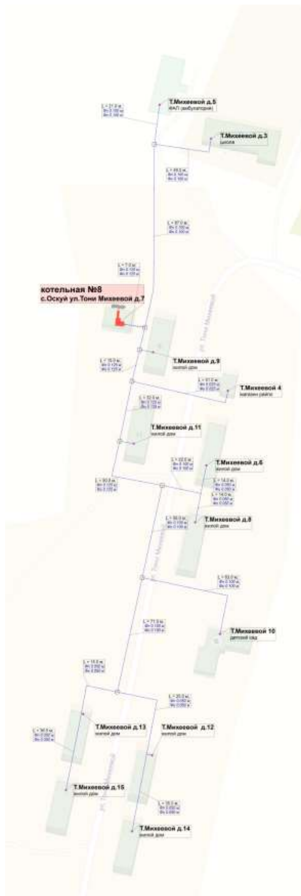
Рисунок 1.3. Схема тепловых сетей котельной № 8 с.Осукуй