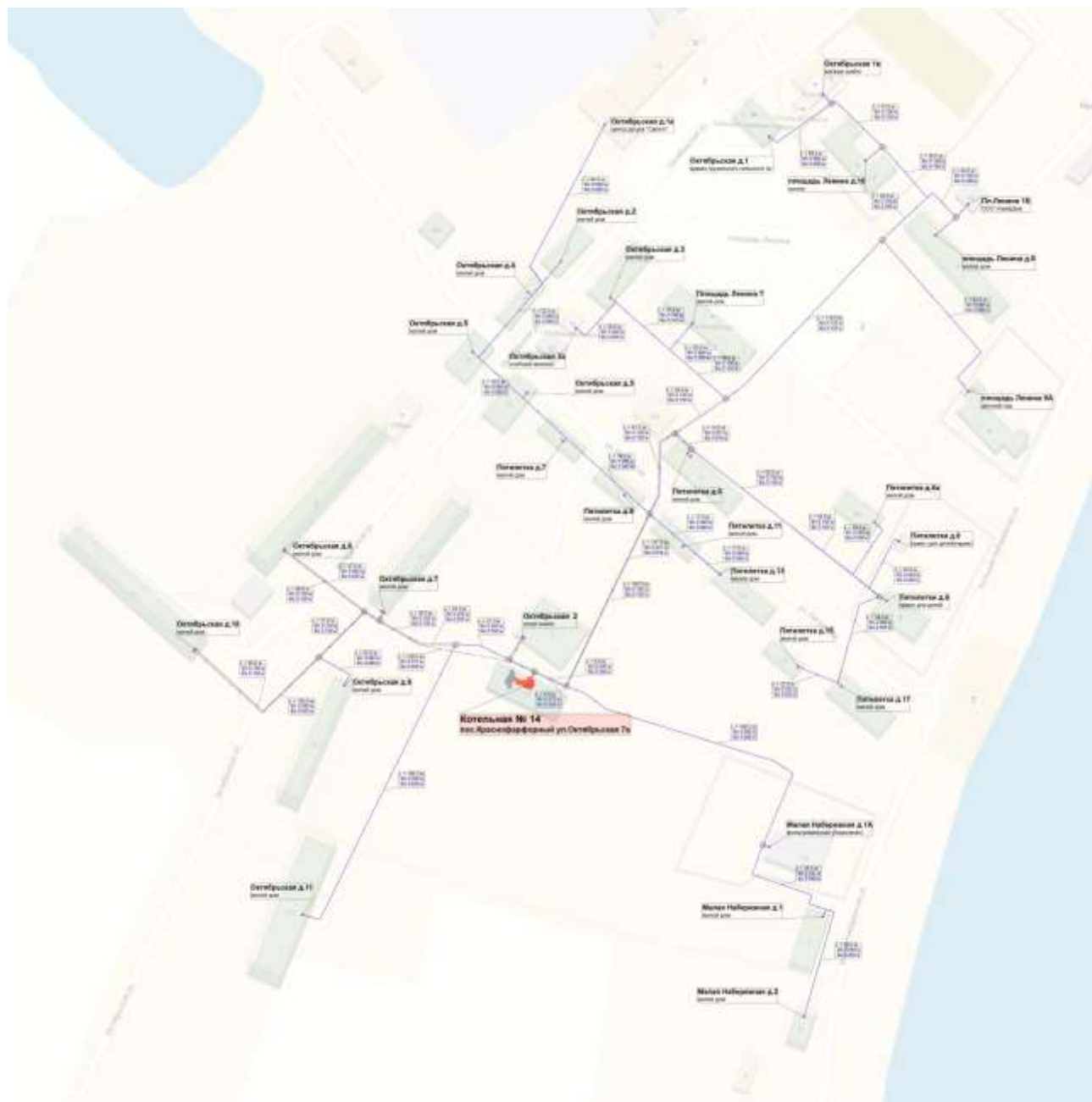
Рисунок 1.2. Схема тепловых сетей котельной № 14 п.Краснофарфорный