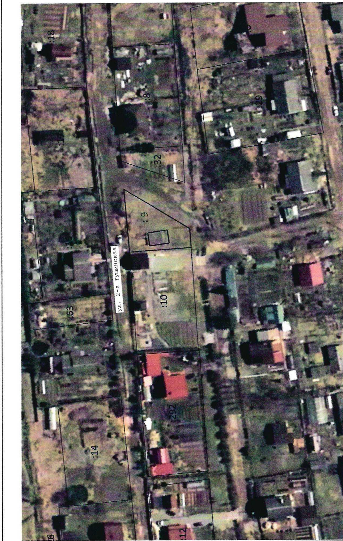
Масштаб 1:1 000