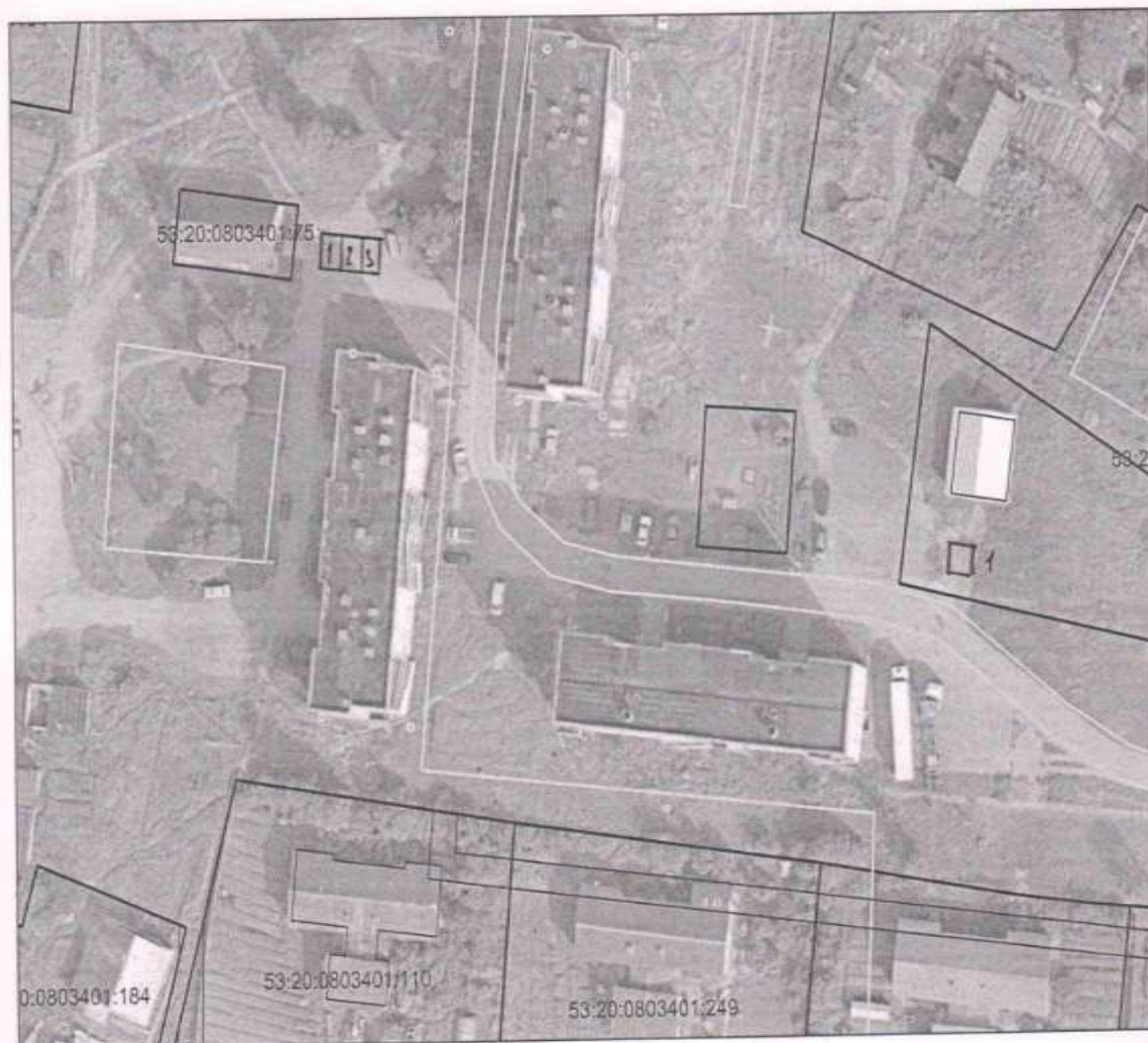
СХЕМА размещения мест продажи товаров на ярмарках с. Успенское

ул. Коммунарная - у здания 5 А - 3 места у здания 3А - место